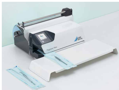
Table à instruments et station Hygofol pour l'installation sur table

Avec les accessoires et les sachets d'emballage du système Hygopac, vous réalisez votre travail avec succès. Le test de soudure Hygopac Sealcheck permet de contrôler chaque jour la qualité de celle-ci, en un clin d'œil. Cela contribue ainsi à encore plus de sécurité.