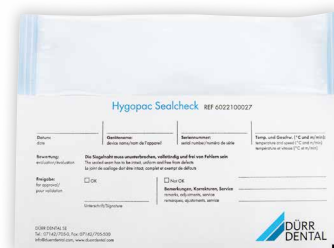
Hygopac Sealcheck, le test de soudure quotidien

Hygopac View représente la nouvelle génération de la soudeuse à défilement Hygopac Plus.