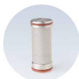
Filtre bactériologique pour le dessiccateur à membranes