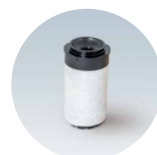
Filtre à coalescence pour le dessiccateur à membranes

Dispositifs Médicaux de classe IIA CE0297. Nous vous invitons à lire attentivement les instructions figurant sur les notices. Produits non remboursés par les organismes de santé.